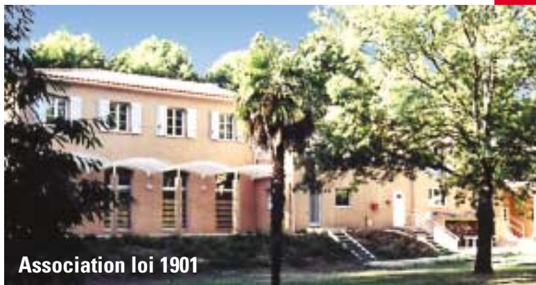
Association loi 1901